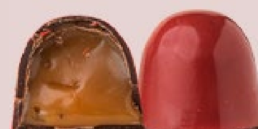
CARAMELO COM FLOR DE SAL