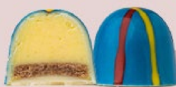
CURAL DE MILHO