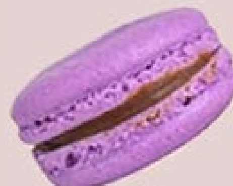
MEL COM LAVANDA