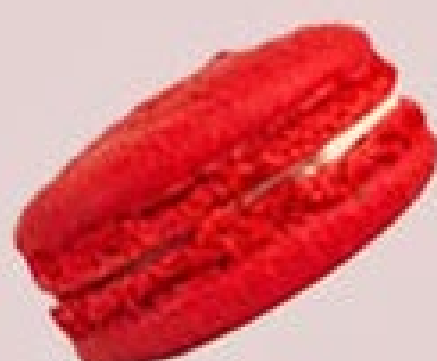
BAUNILHA COM MORANGO