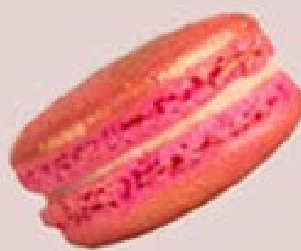
PERA COM ROSAS