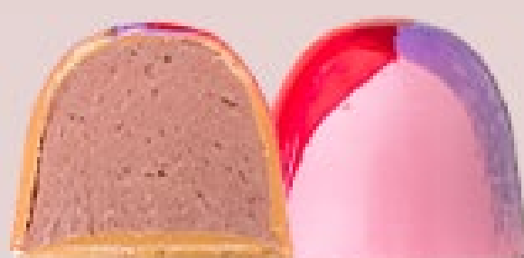
CARAMELO COM FRAMBOESA