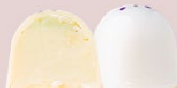
LAVANDA COM LIMÃO