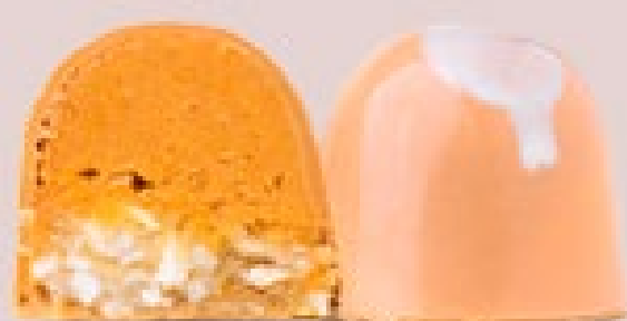
ABÓBORA COM COCO